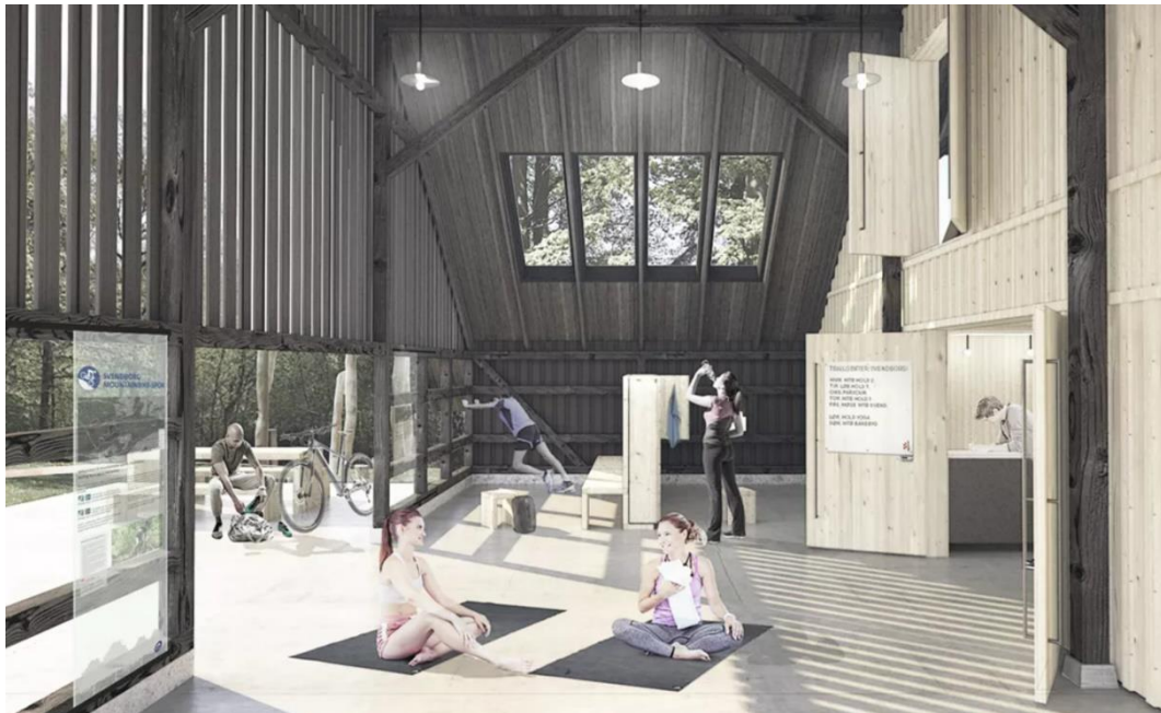
Billede 3. eksempel på et åbent aktivitetsområde