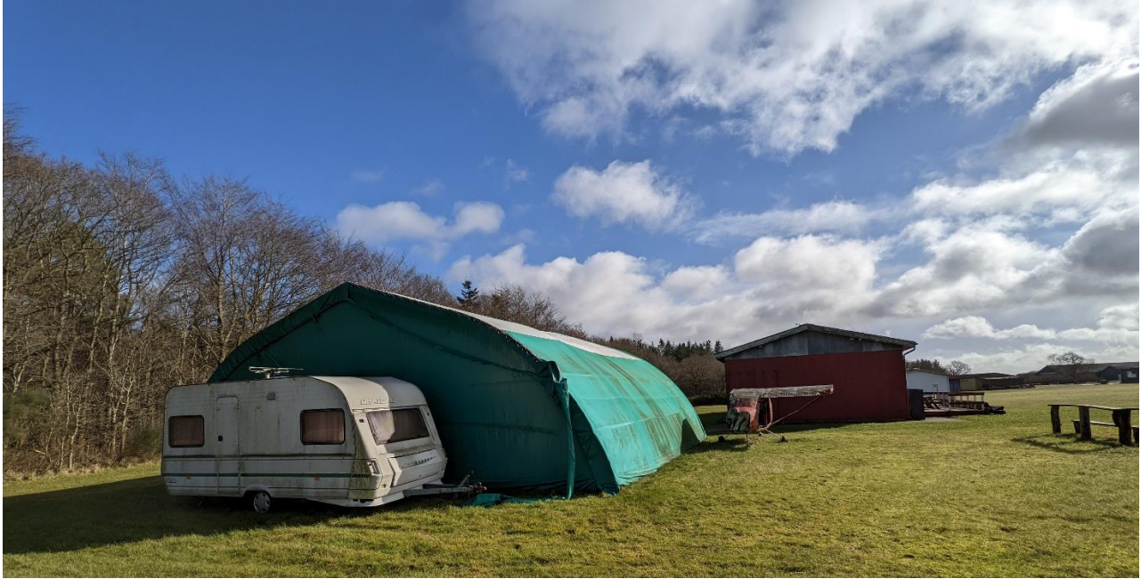
Billede 3. pakketeltet

Derudover råder klubben over et mere end 20 år gammelt telt uden varmetilførelse, som bruges til at pakke faldskærme året rundt (Billede 3.). Pakketeltet har huller og rifter.