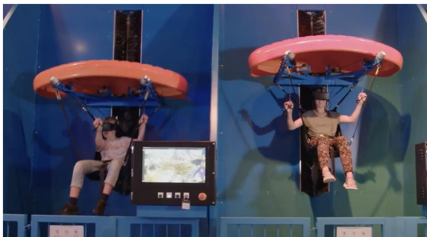
Billede: Universe Science Park i Nordborg

Universe Science Park i Nordborg (Danmark) har udviklet et spil, hvor brugeren sidder i en fysisk anordning og kan styre en faldskærm, ved at trække i snorene. Tryk på dette LINK for at se en kort video af anordningen.