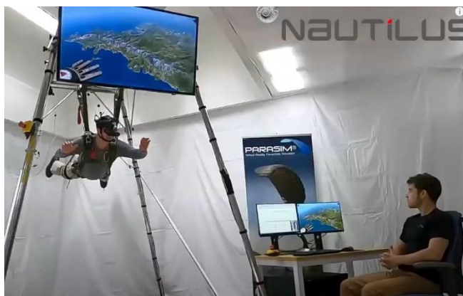
Billede: PARASIM anordning

Virksomheden SkydiVR har udviklet AR faldskærmsudspring, som her i videoen benyttes til undervisning. I videoen på dette LINK , ses instruktøren give instrukser, mens han viser, hvordan disse udføres i virkeligheden. Lignende er ligeledes blevet udviklet af virksomheden PARASIM, som kan ses på dette LINK og virksomheden Para Parachute, som kan ses på dette LINK .