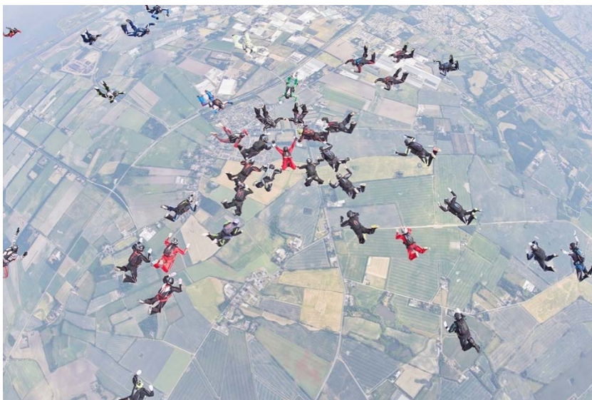
Billede fra Hercules rekordforsøget i 2018