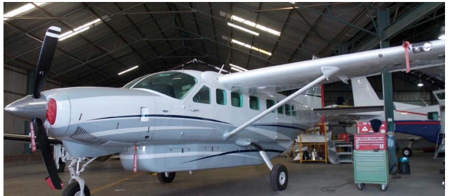
FDK's nye Caravan