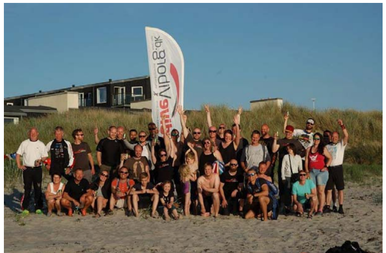
Stemningsbillede fra stranden på Læsø – Skydive Viborg's årlige klubbtur