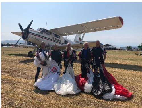
Billede af Præcisionslandsholdet