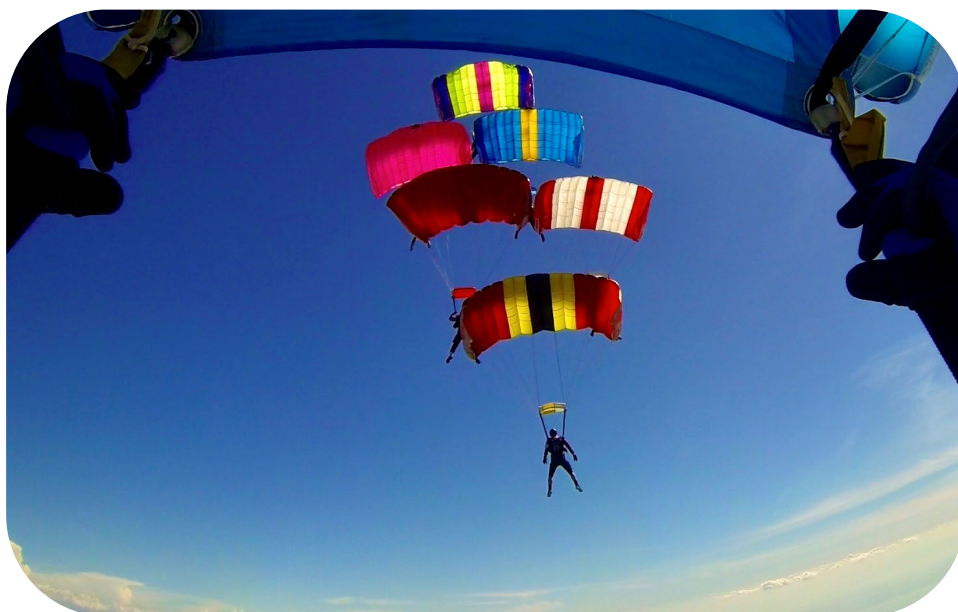
Billede taget ifm. Canopy Formation træning

LØRDAG D. 16. marts 2024 KL. 10.00 – 15.00