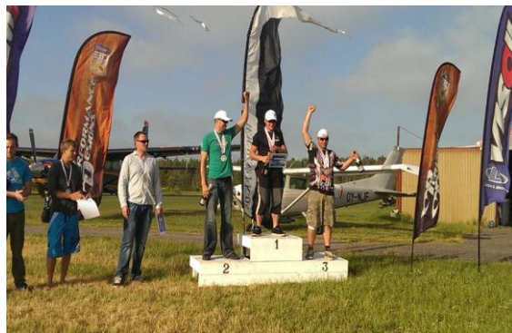
Tak til NJFK for et godt arrangement, tak til alle der deltog og tillykke til vinderne!